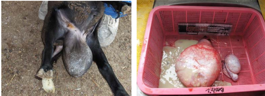
Borrego infectado con Brucella ovis con testículos desiguales : Testículo izquierdo presenta epididimitis severa, y testículo derecho normal Testículo izquierdo presenta epididimitis severa por Brucella ovis