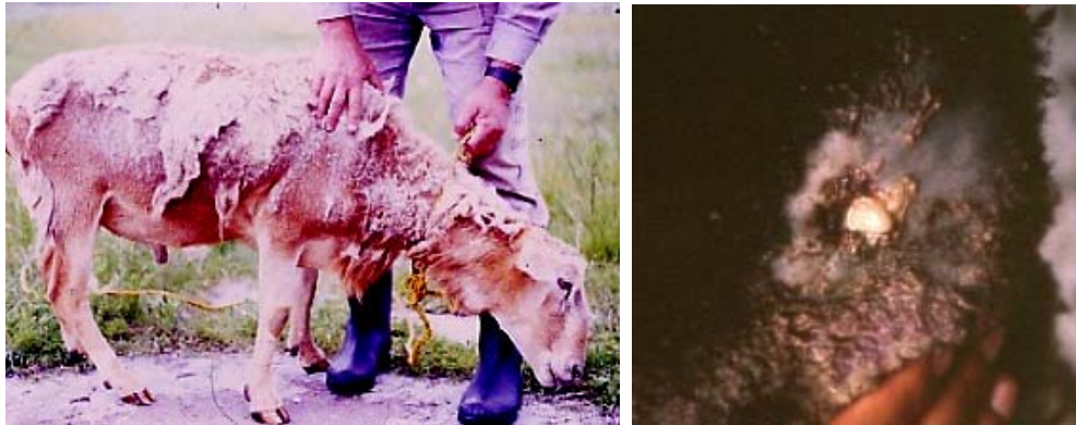
Foto Izq.: Semental adelgazado, con tumor de linfadenitis bajo la mandíbula. Foto Der.: Absceso drenando al exterior

La otra forma de la enfermedad es la llamada visceral, porque los abscesos se presentan en órganos internos, en particular pulmón e hígado; cuando estos abscesos en los órganos son muy abundantes los animales sufren el cuadro de adelgazamiento progresivo, sin presentar en la mayoría de los casos ninguna otra alteración. El aspecto de las lesiones y el adelgazamiento de los animales afectados, explica que la enfermedad también se conozca como Pseudotuberculosis (Falsa tuberculosis). Es importante anotar aquí que no hay riesgo de confundir el diagnóstico, porque la tuberculosis no afecta a las ovejas.