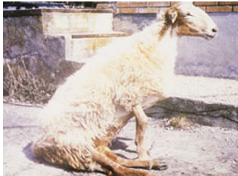
Oveja derrengada con Maedi-Visna.

Maedi-visna. Esta enfermedad es producida por un retrovirus y determina un cuadro respiratorio crónico en animales adultos- viejos con insuficiencia respiratoria y adelgazamiento progresivo. Ocasionalmente los animales pueden demostrar incapacidad para mantenerse en pie, por fallas en la postura del tren posterior, se derrengan. Recientemente un lote de algo más de 300 animales de pie de cría exportados por México a Colombia, fueron sacrificados en aquel país por haber resultado serológicamente positivos a la enfermedad.