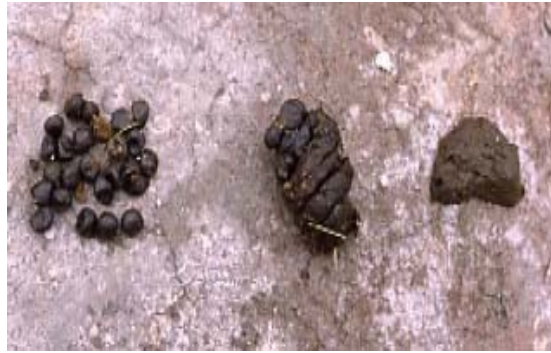
Izquierda excremento normal, al centro y derecha diarrea; posible Paratuberculosis.

Se pueden también realizar pruebas serológicas, pero estas pruebas solo indican que el animal está infectado y no necesariamente enfermará.