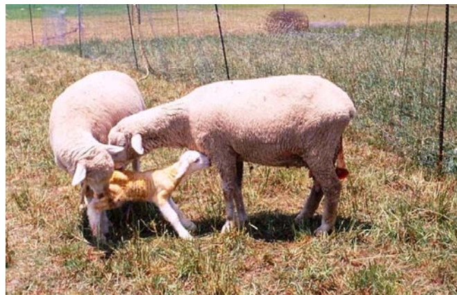
Foto 2. Intento de robo de una oveja por parir a una recién parida

Otra causa es la interferencia entre la oveja recién parida y las que están próximas a parir. Se ha observado que estas últimas pueden tender a robar o adoptar los corderos de las recién paridas (Foto 2).