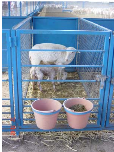
Foto 7. Corraleta paridero fija, debe ser amplia, fácil de limpiar, con cama y agua y comida a libertad.