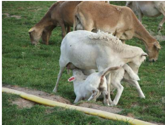
Foto 4. Corderos que están mamando con éxito, se observa la cola levantada y en movimiento.