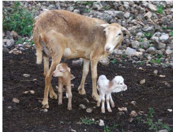
Foto 1. Oveja primeriza con dos corderos pequeños y con bajo peso