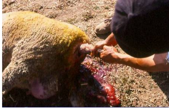
Foto 3. Cordero que no puede nacer y es sacado por el técnico. Lo más probable es que muera por lesiones en cerebro.

Algunas causas de distocia son el tamaño del cordero (muy grandes), mala posición y tamaño reducido de la pelvis entre otros, además de las ya mencionadas asociadas a la mala alimentación y pobre condición corporal de la oveja.