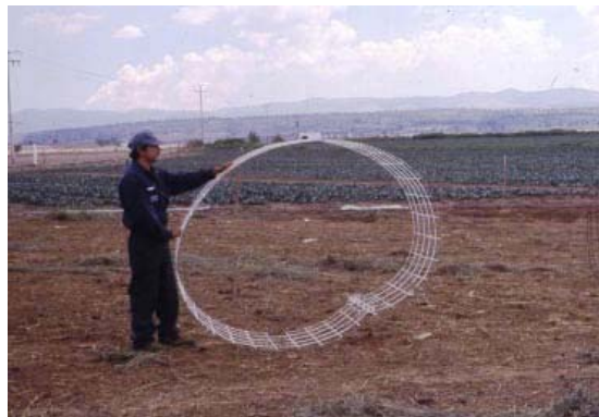
Foto 5. Malla electro soldada cortada a 90 cm de altura y con una longitud de 6 m que sirve como corraleta paridero

Preparar unas corraletas paridero movibles como la que se muestran en las Fotos 5, 6 y 7, que se les colocan cuando la oveja inicia el proceso de parto o está recién parida, esto evita robos (Foto 10) y afianza la relación cordero – madre, aumentando la sobrevivencia de la cría.